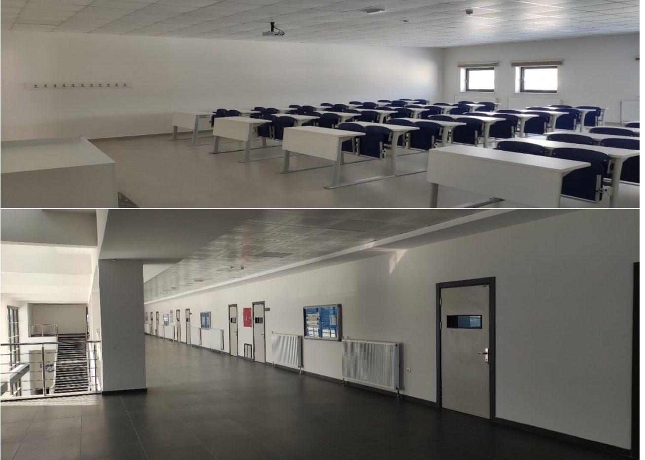
Şekil 2. Derslik ve laboratuvarlarımız