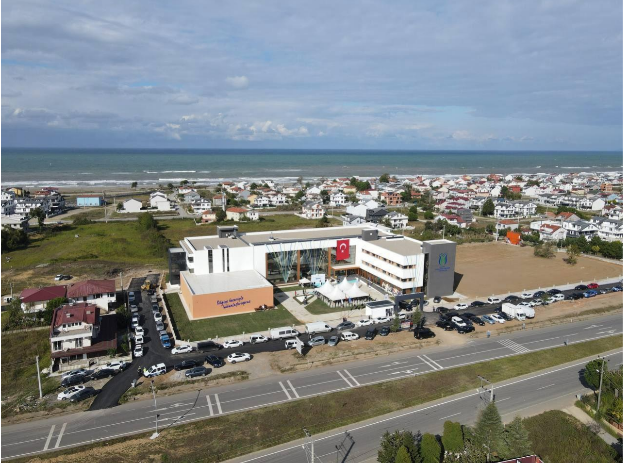
Şekil 1. MYO Yerleşkemiz

Sakarya Uygulamalı Bilimler Üniversitesi Denizcilik MYO Motorlu Araçlar ve Ulaştırma Teknolojileri Bölümü altında yer alan Gemi İnşaatı programı 2020/2021 yılında öğrenci alımına başlamıştır. Denizcilik MYO içerisinde yer alan program, Kocaali kampüsünde eğitim ve öğretimine devam etmektedir.