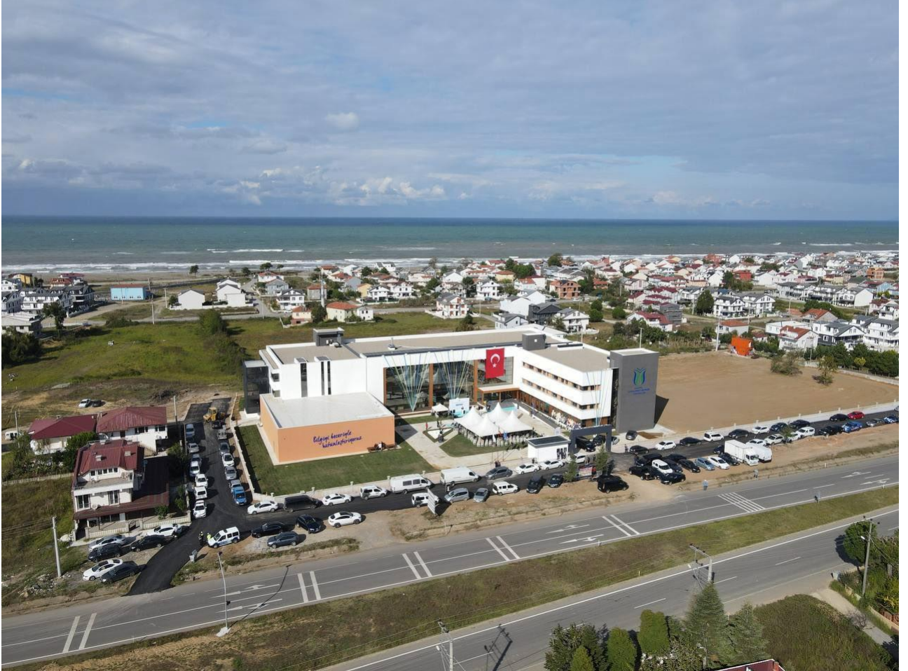
Şekil 1. MYO Yerleşkemiz

Sakarya Uygulamalı Bilimler Üniversitesi Denizcilik MYO Motorlu Araçlar ve Ulaştırma Teknolojileri Bölümü 2020/2021 yılında öğrenci alımına başlamıştır. Denizcilik MYO içerisinde yer alan bölüm, Kocaali kampüsünde eğitim ve öğretimine devam etmektedir.