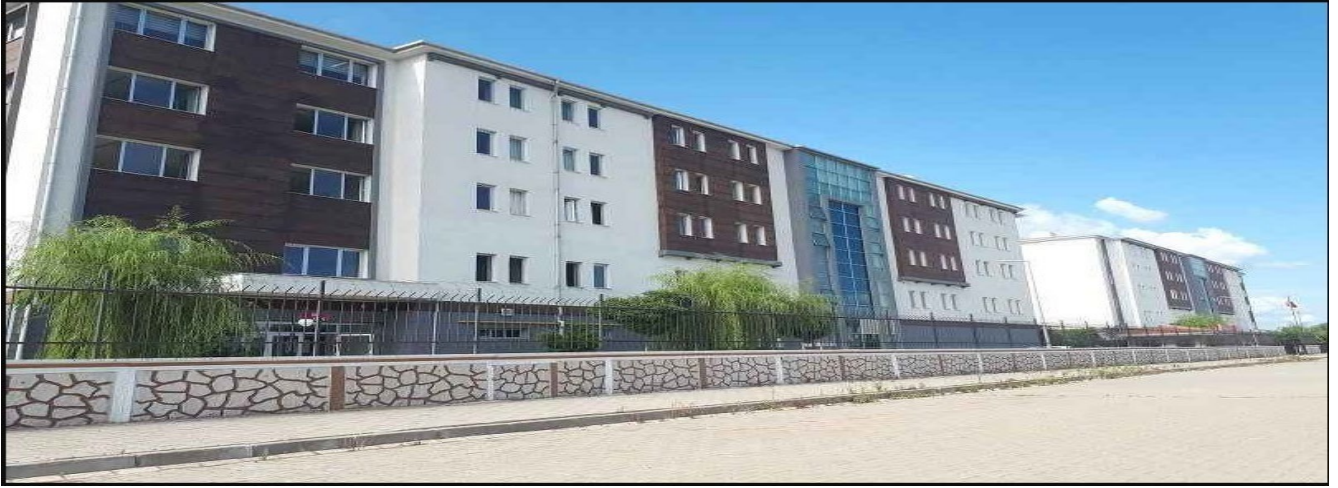
Resim 2: Karasu KYK Yurdu

Denizcilik Meslek Yüksekokulu Yerleşkesine 15 kilometre mesafede bulunan Karasu ilçesinde Kredi Yurtlar Kurumu'nun (KYK) 400 kişilik öğrenci yurdu bulunmaktadır.