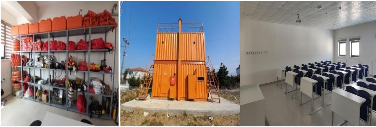
Resim 3: Derslik ve laboratuvarlarımız