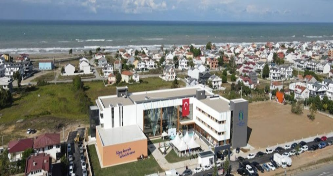
Resim 1: MYO Yerleşkemiz

Sivil Savunma ve İtfaiyecilik Programı, Sakarya Uygulamalı Bilimler Üniversitesi Denizcilik MYO Mülkiyet Koruma ve Güvenlik Bölümünün altında bulunmakta olup, program 2020/2021 yılında öğrenci alımına başlamıştır. Denizcilik MYO içerisinde yer alan bölüm, Kocaali kampüsünde eğitim ve öğretime devam etmektedir.