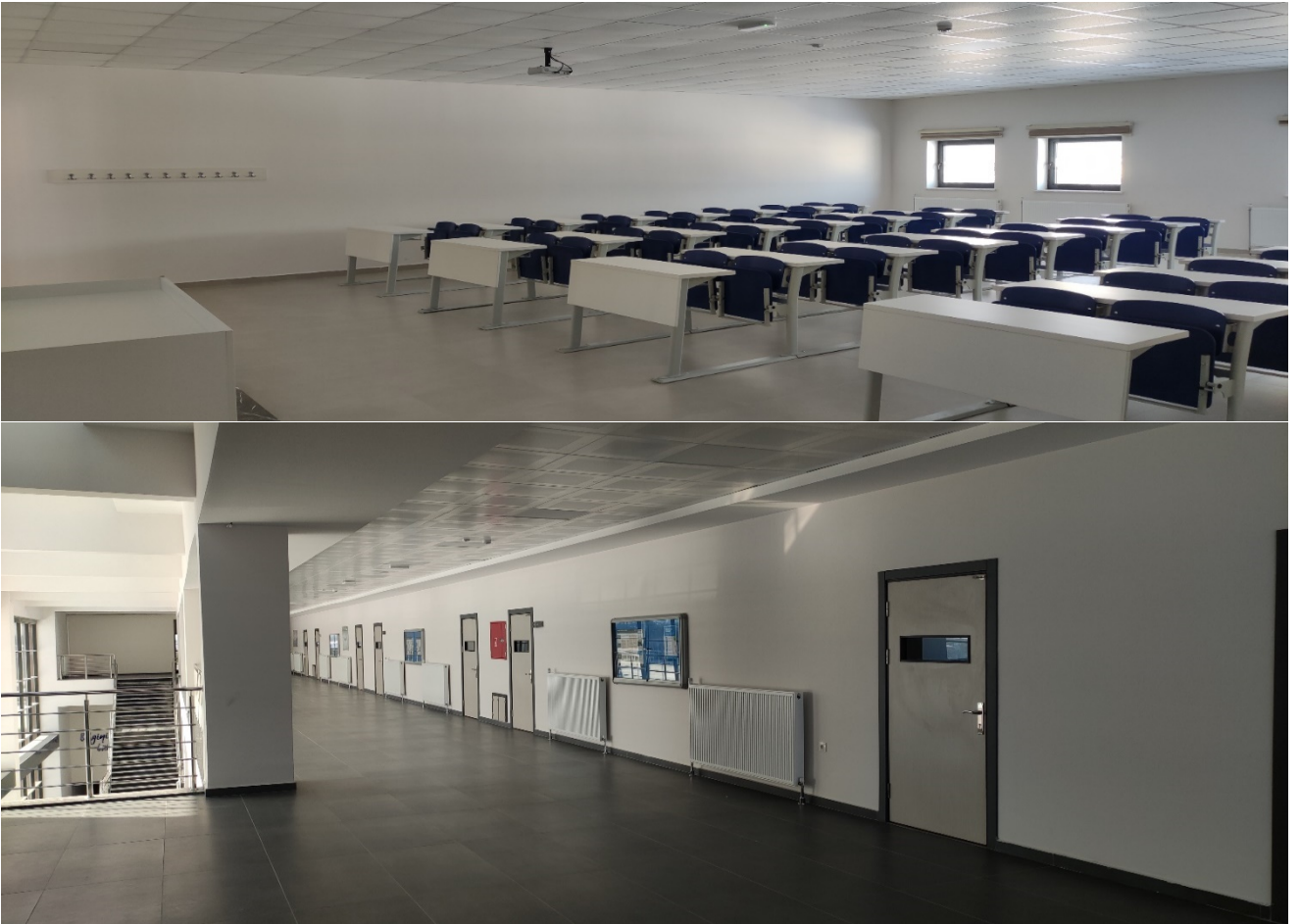
Şekil 2. Derslik ve laboratuvarlarımız