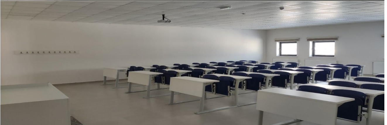
Resim 1. MYO Yerleşkemiz