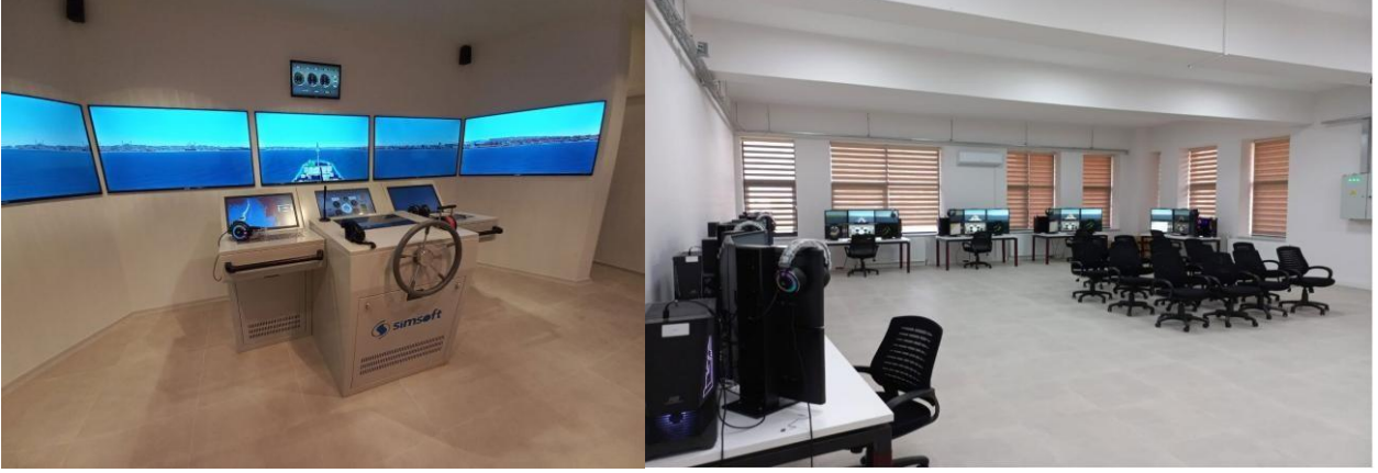
Resim 3. Derslik ve laboratuvarlarımız