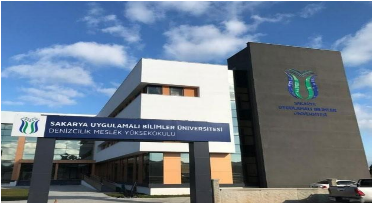
Resim 2. Okulumuz

Değerlendirme sonuçları; Bakanlık internet sayfası http://sonuc.gsb.gov.tr adresinden duyurulmaktadır.