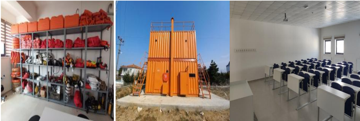
Resim 3: Derslik ve laboratuvarlarımız