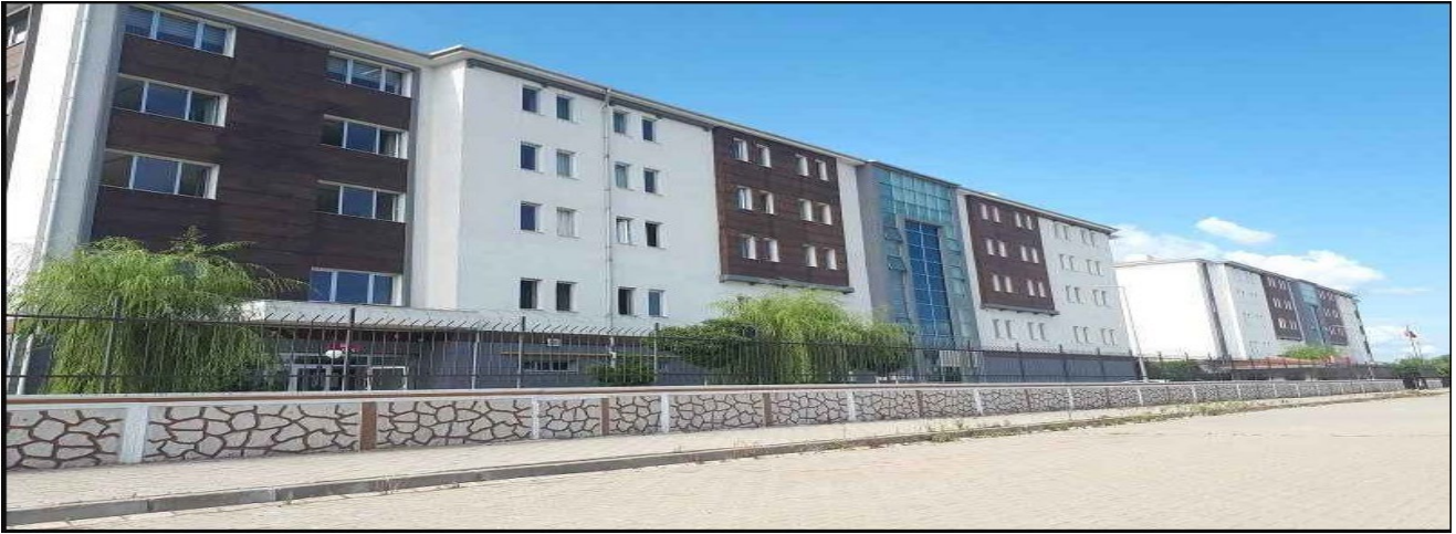
Resim 2: Karasu KYK Yurdu

Denizcilik Meslek Yüksekokulu Yerleşkesine 15 kilometre mesafede bulunan Karasu ilçesinde Kredi Yurtlar Kurumu'nun (KYK) 400 kişilik öğrenci yurdu bulunmaktadır.